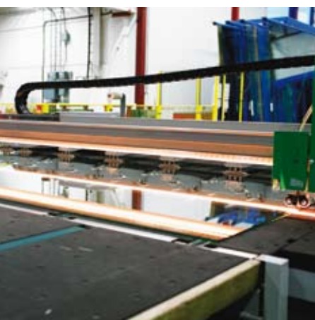
Vår högeffektiva lamellskärlnje.