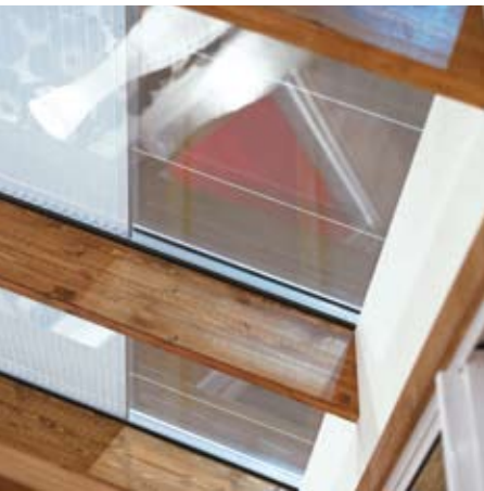
Takglas med persiennfunktion.