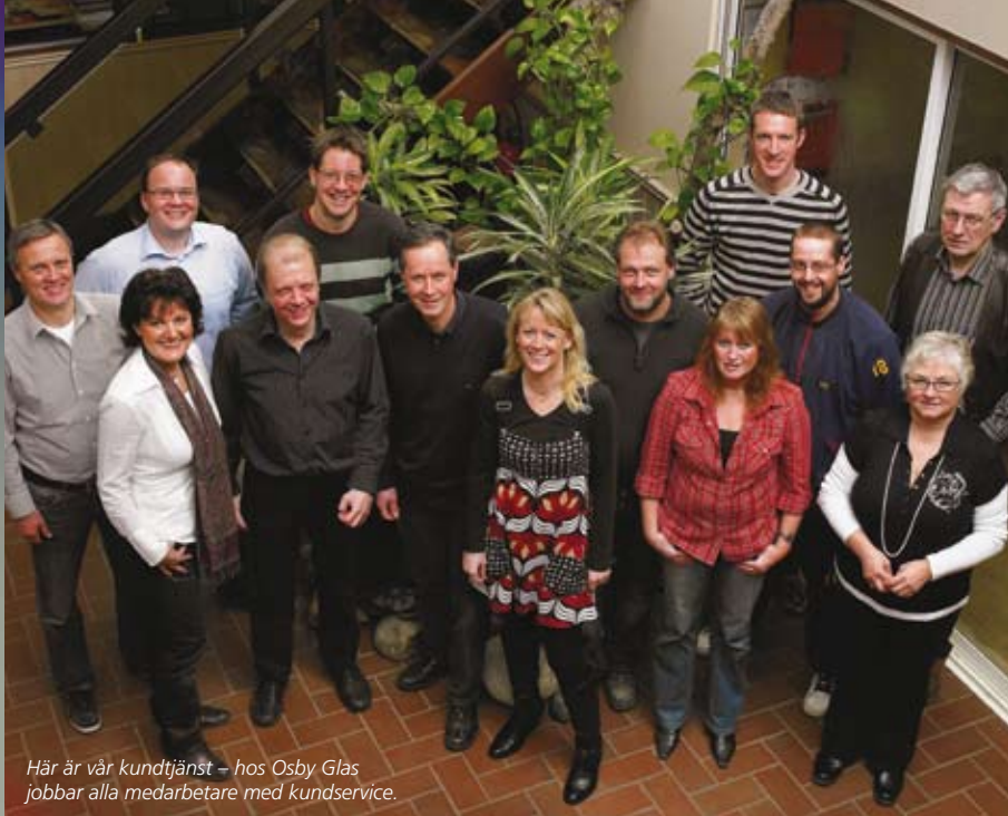
Här är vår kundtjänst – hos Osby Glas jobbar alla medarbetare med kundservice.