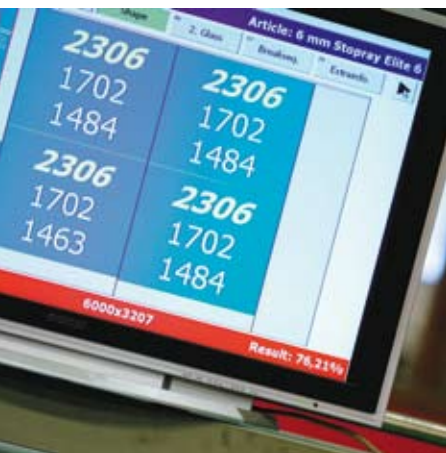
Minutiös produktionskontroll – affärsystemet informerar skäraren.