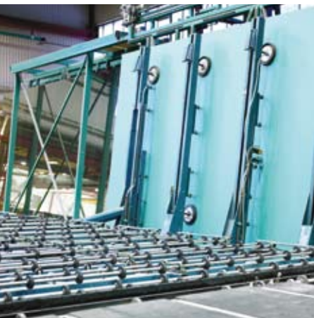
Jumboskiva i nertagaren, för skärning.