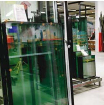
Isolerglas färdiga för emballering.