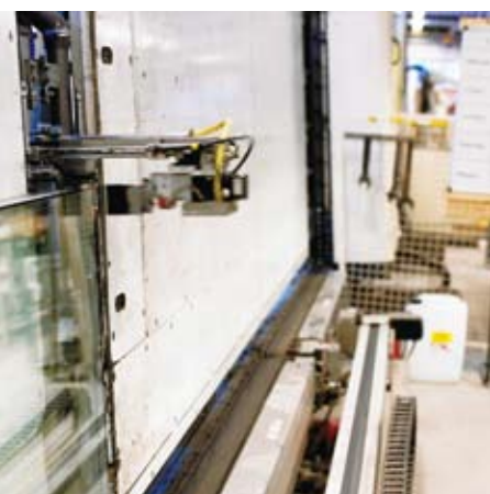
Förseglingsroboten i vår 2.70-linje.