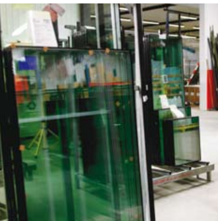
Isolerglas färdiga för emballering.